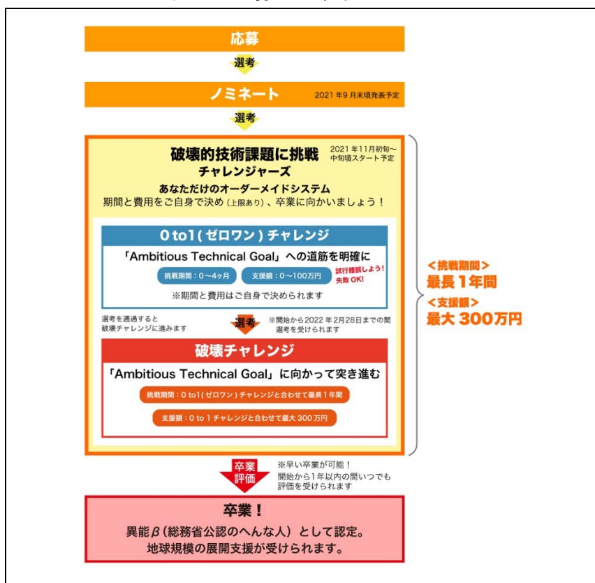
図2：応募から卒業までのプロセス